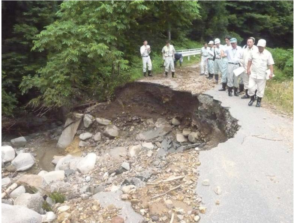
集中豪雨による災害現場視察